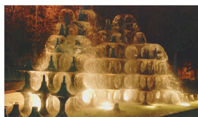
Brunnen in Lyon