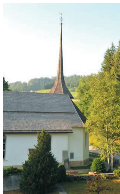
Kirche Eggiwil