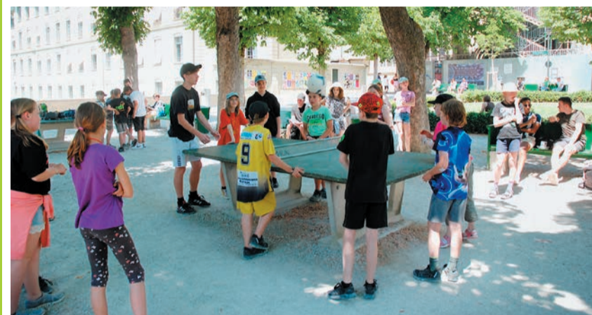
Konfirmation Eggiwil 2023