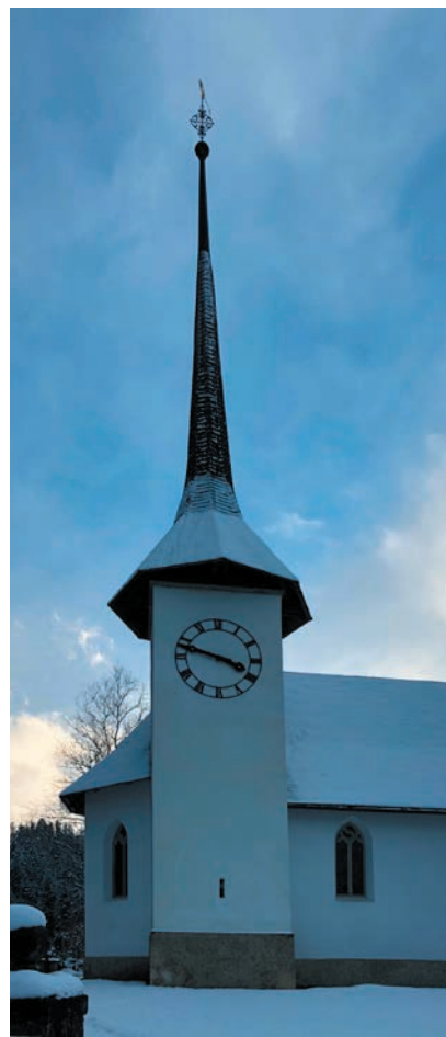
Kirche Eggiwil