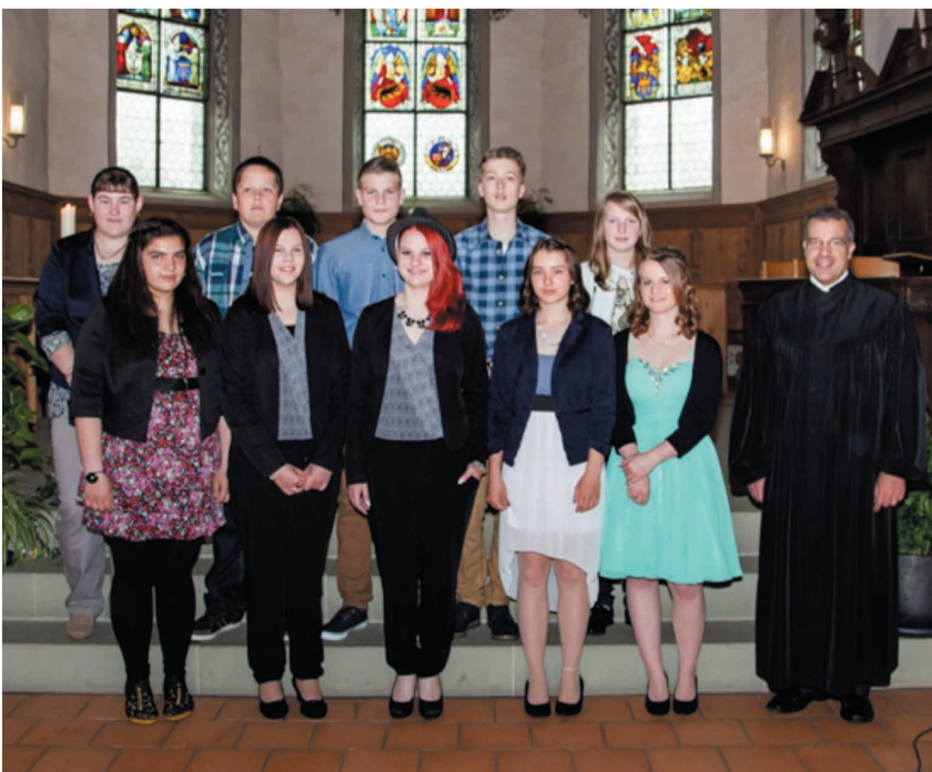
Beim anschliessenden Apéro pflegten wir die Gemeinschaft.