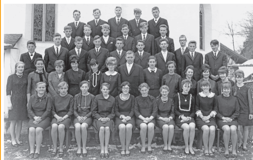
Konfirmation Palmsonntag 1968